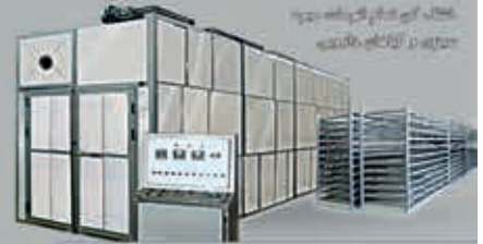
خط کامل شستشو میوه و سبزیجات