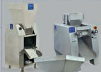
پوست کن آجیل خلال کن خشک کن فرآورنده کشمش پوست کن گردو آجیل خلال کن تبریزکار تبریزکار