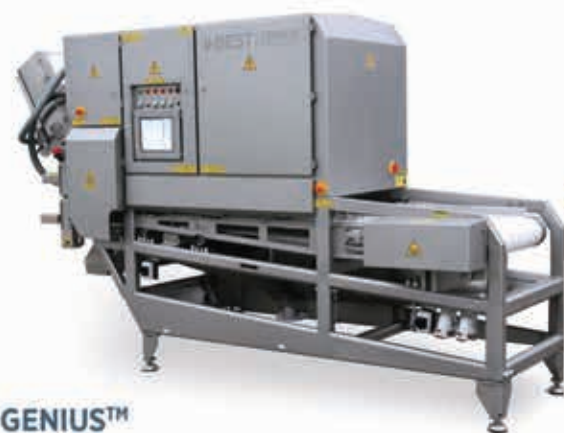
GENIUS™ سورتر دوربینی