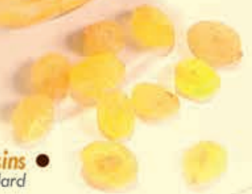
● GOLDEN Raisins ● Jumbo & Standard

Natural quality, enhanced by careful handling and high technology