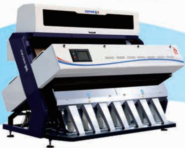
سورتر دوربینی Camera Sorter

تنها شرکت تولیدکننده همزمان دستگاه های سورت دوربینی و ایکس ری در چین با تولید سالانه بیش از ۳۵۰۰ دستگاه و ۲۰۰۰۰ دستگاه نصب شده در سرتاسر جهان