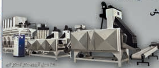
ماشین آوری مغز گردو