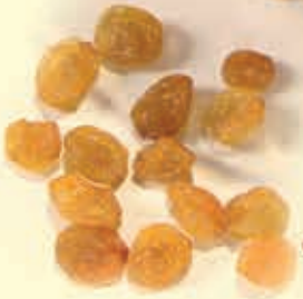
● SULTANA/MALAYER Raisins Light & Dark color