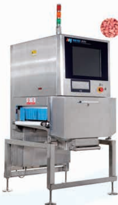
سورتر ایکس ری X-Ray Sorter