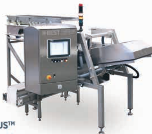
HELIUS™ لیزر سورتر