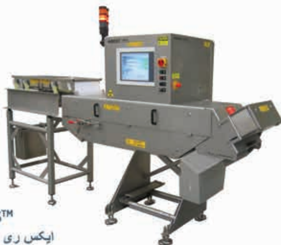
IXUS™ ایکس ری سورتر