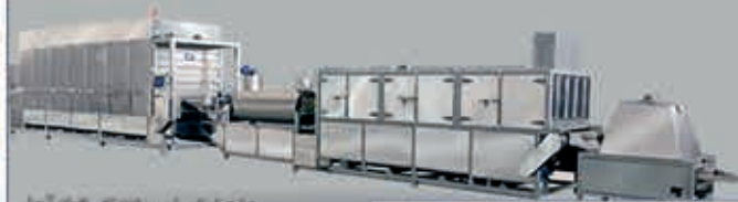
خط کامل پوست برداشتن آجیل و خلال کن