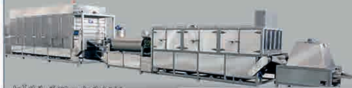
خط تمام اتوماتیک برشته کن آجیل / تفت دهی در دمای کنترل شده