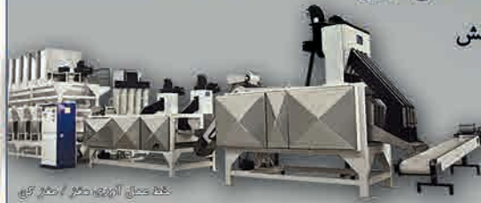
خط عمل آوری مغز گردو / آجیل کن