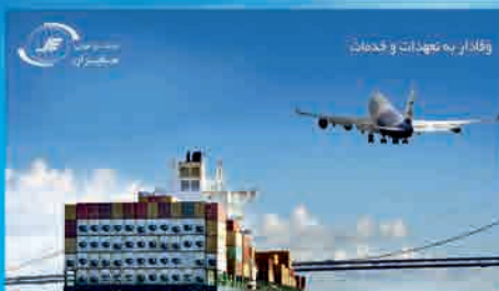
وقادار به تجهیزات و خدمات