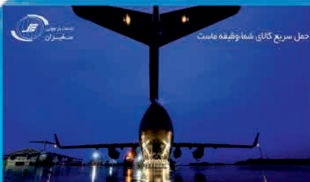
حمل سریع کالای شما و تحویل به دست