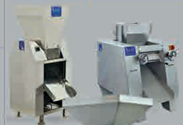
پوست گیر مغز گردو طاوله کن خشک کن فرود کن فرود کن پوست پوست کن آسیاب تاری کردن ریس گراوند سبزی غذا کن