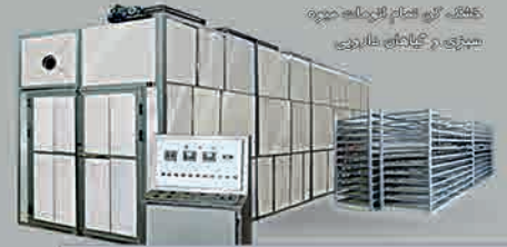
خشک کن میوه / سبزیجات / میوه خشک کن / سبزیجات خشک کن