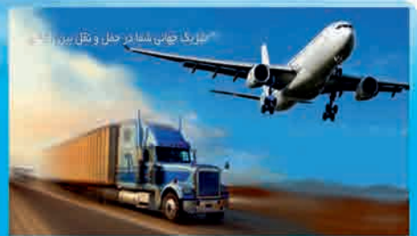
بزرگ جهان: شایسته حمل و نقل بین المللی

آدرس: خیابان قائم مقام فراهانی ، شماره ۱۱۴ ، طبقه ۲ ، واحد ۱۰ تلفن: ۸۸۸۳۰۲۱۵ - ۱۷ فکس: ۸۸۸۳۰۲۱۸ فرودگاه امام خمینی ، ترمینال بار ، دفتر شماره ۱۳ Email: airport@safirancs.com تلفن: ۴۴۶۶۶۷۴۹ - ۴۴۶۶۶۷۴۶ دفتر شیراز : ۲۰ متری سینما سعدی ، چهارراه هدایت ، ساختمان آق بانو ، طبقه ۳ ، واحد ۱